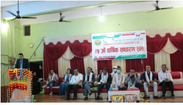
२५ औं वार्षिक साधारण सभाको भलक ।