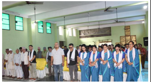
२५ औं वार्षिक साधारण सभामा राष्ट्रिय गान र लुम्बिनी साकोस गान गर्दै ।